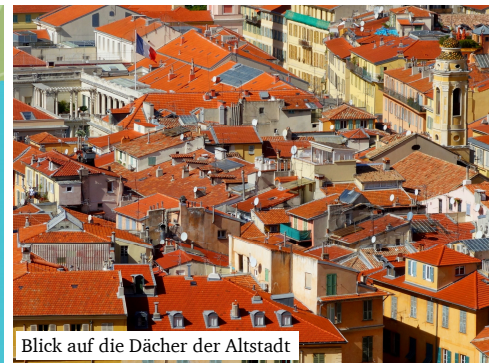
Blick auf die Dächer der Altstadt