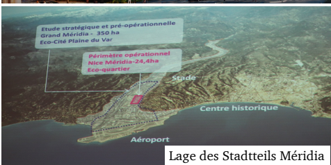
Lage des Stadtteils Méridia