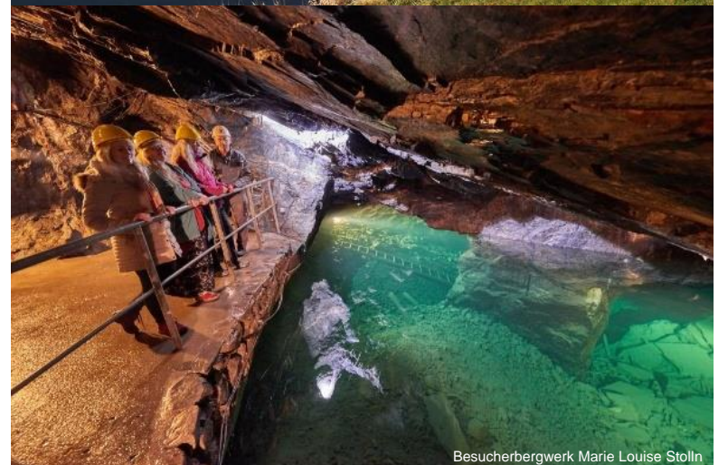
Besucherbergwerk Marie Louise Stolln